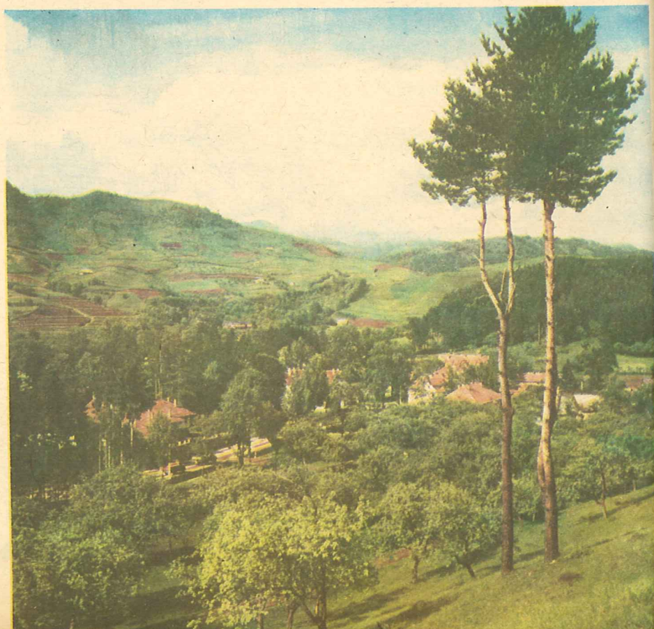
Fig. 1. Peisaj din natură.

Toate corpurile cu viață și fără viață (solide, lichide, gazoase) formează natura.