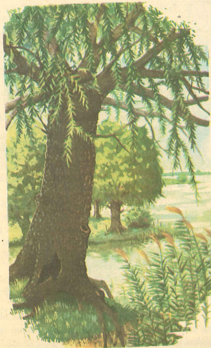
Fig. 53. Salcia.

Florile sînt galbene-verzui și strînse la un loc sub forma unor mîțișori.