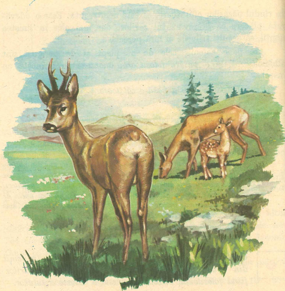
Fig. 51. Țap, căprioară, ied.

Căprioara are blana cafenie. Botișorul ei este alungit și catifelat. Ochii sînt mari și blinzi, iar urechile ascuțite, ridicate în sus, gata oricînd să audă cel mai mic zgomot, care ar putea anunța un pericol. Trupul zvelt se termină cu o codiță. Cu picioarele lungi și subțiri, fuge foarte repede. Atunci cînd este în pericol, cea mai sigură scăpare a ei este fuga.