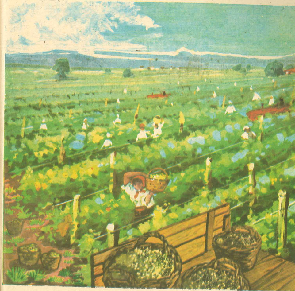
Fig. 40. Harnici cooperatori la cules de struguri.