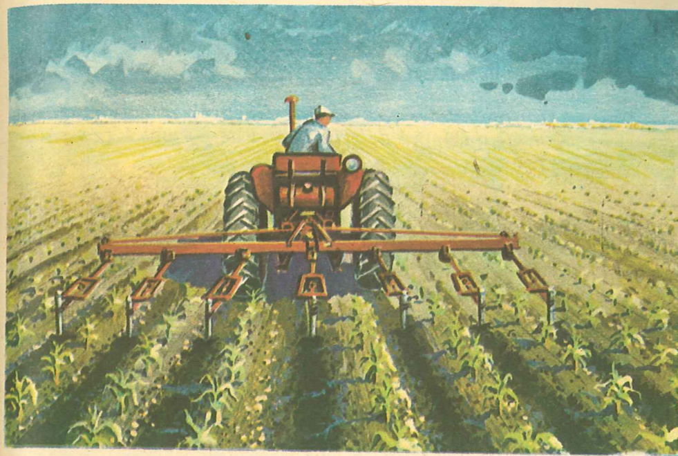
Fig. 22. Prășitul porumbului cu mașina.