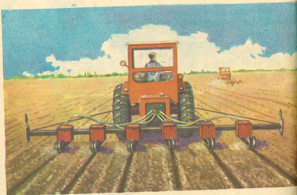
Fig. 21. Semănatul porumbului.

În țara noastră, țărani cooperatori obțin recolte sporite de porumb în fiecare an.