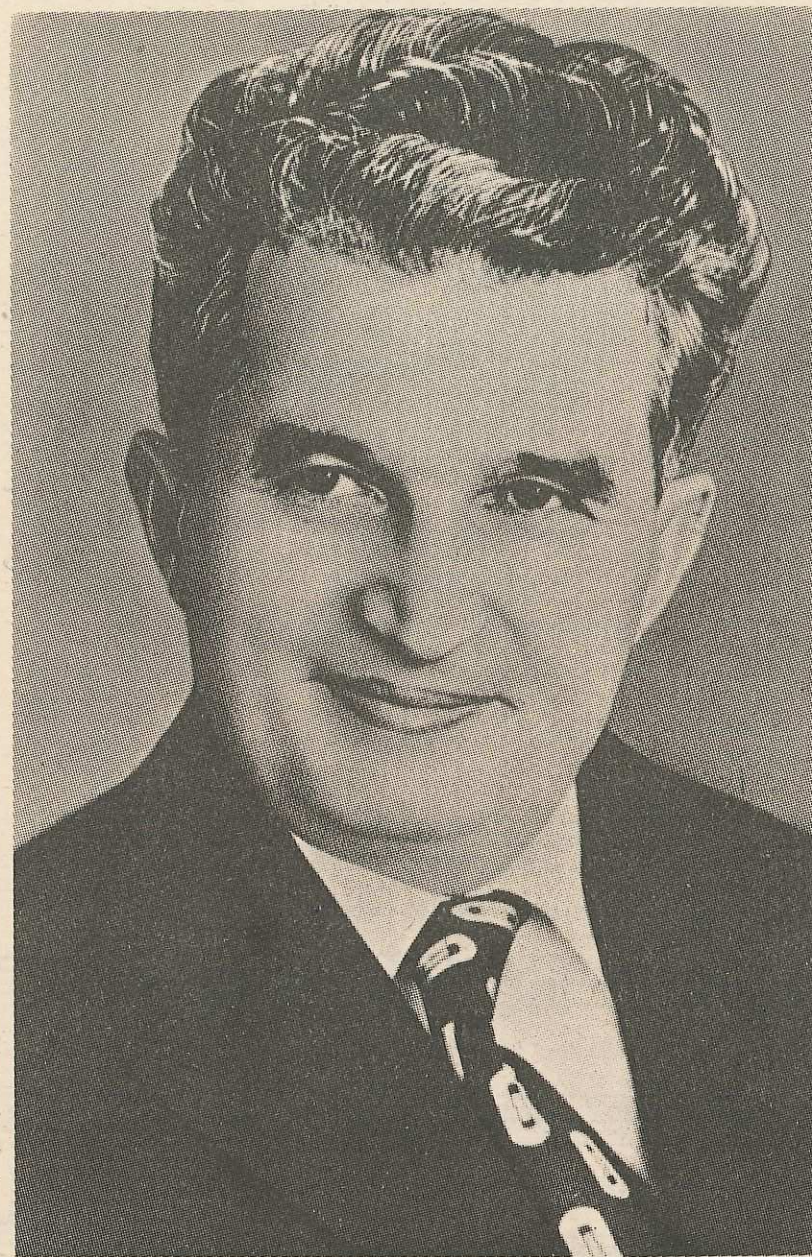
TOVARĂȘUL NICOLAE CEAUȘESCU, secretar general al Partidului Comunist Român, președintele Republicii Socialiste România

Com. nr. 60 546/33 015 Combinatul Poligrafic „CASA ȘINTEII“ București — R.S.R.