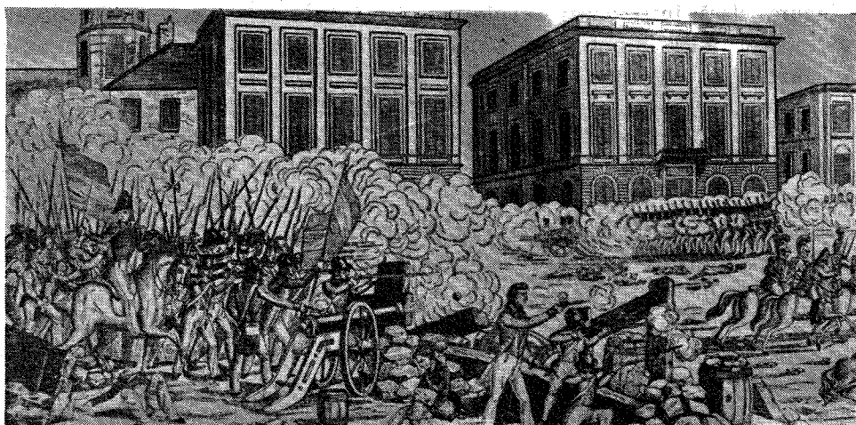
Răscoala țesătorilor din Lyon (1831); armata regală trage în muncitori.

Crearea socialismului științific, concepție revoluționară despre dezvoltarea societății omenеști. Prin lupta mătăsarilor din Lyon, a țesătorilor din Silezia și mai ales a chartiștilor, proletariatul a acumulat o experiență importantă care a făcut posibilă nașterea unei teorii științifice, corespunzătoare